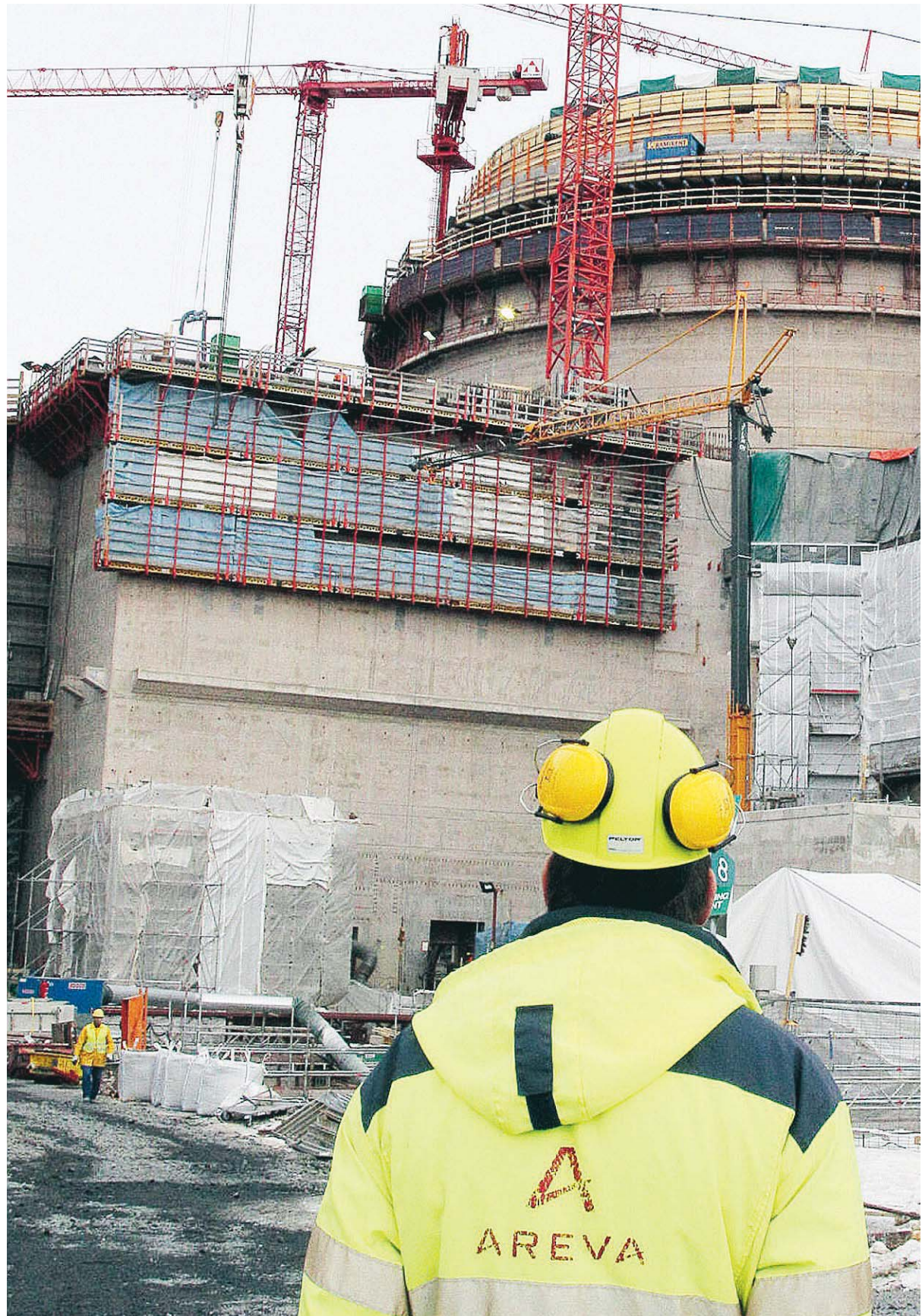
Bygget av den tredje reaktorn vid kärnkraftverket i finska Olkiluoto har sprängt både tids- och kostnadsramarna.