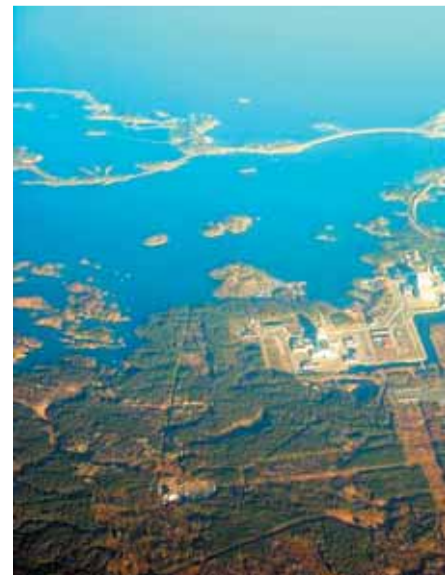
Forsmark. Regeringen vill öppna för

"Jag gjorde ett utkast som jag kommunicerade med folk i miljörelsen och med riksdagsgruppens ledning och jag hade kontakter med jurister och andra