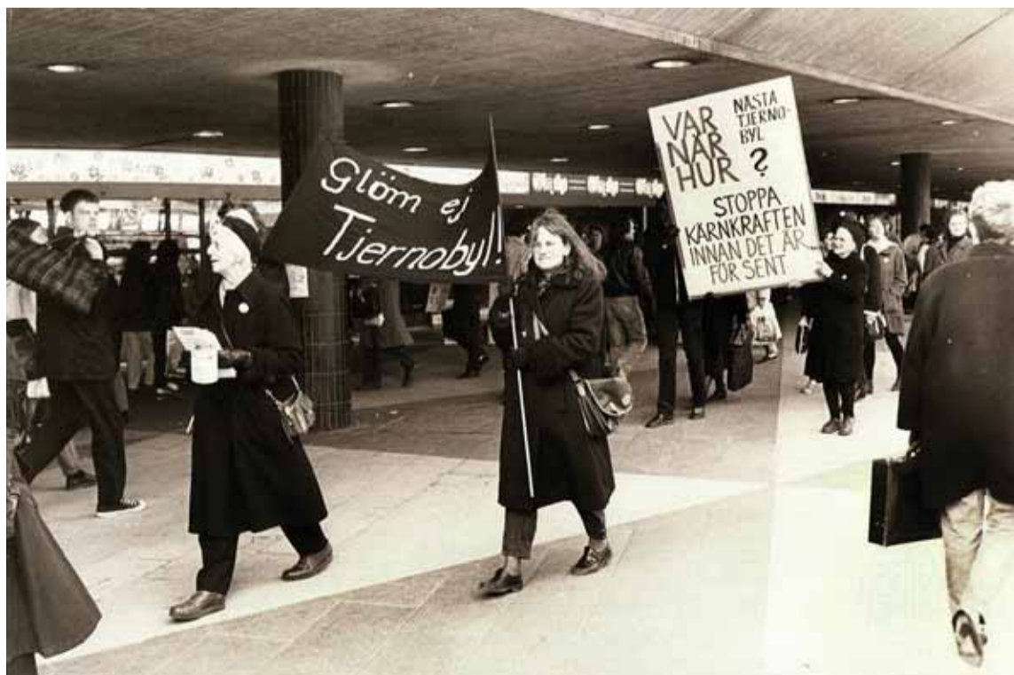
Demonstration mot kärnkraft med allvarliga påminnelser på banderollerna.