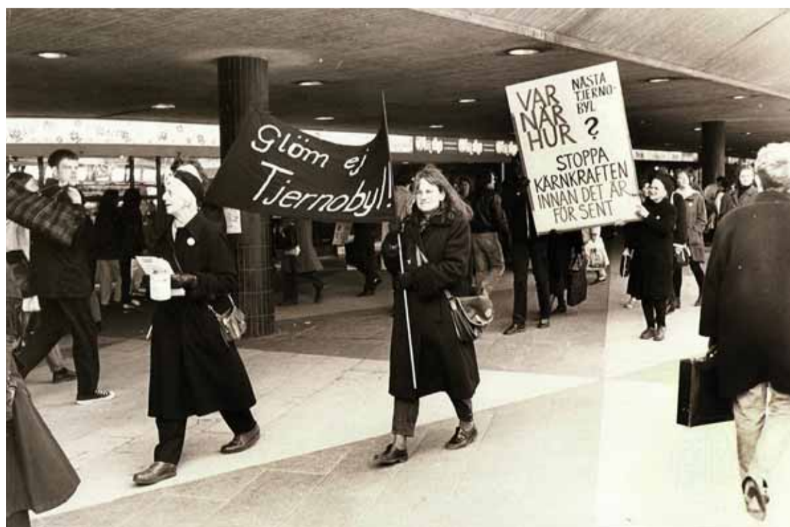
Demonstration mot kärnkraft med allvarliga påminnelser på banderollerna.